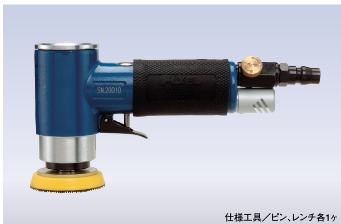
仕様工具/ピン、レンチ各1ヶ