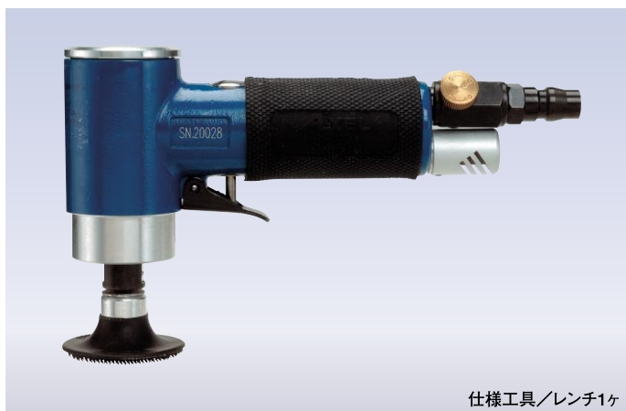
仕様工具/レンチ1ヶ